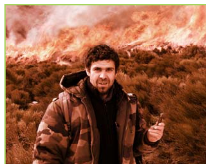
> Ca sent le roussi (Lauréat 2007)

Le jury du festival est toujours constitué de jurés provenant d'horizons différents et complémentaires. Il compte dans ses rangs des témoins au quotidien de la vie en milieu rural (agriculteur, éleveur...), des professionnels de l'audiovisuel (réalisateur, producteur...), des journalistes (spécialistes de la question agricole) et des acteurs du monde institutionnel. La tradition veut que le vainqueur du 1 er prix du festival revienne l'année suivante comme membre du jury.