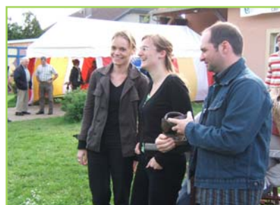
> Remise du sabot de bronze