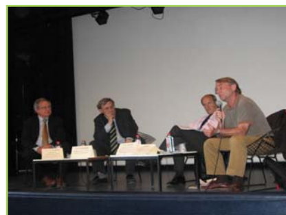
> L'image comme support des débats

Le festival « Caméras des Champs » a pour objectif de montrer les mutations des mondes ruraux à travers la projection de films documentaires initiant débats avec le public, table ronde, expositions et atelier de lecture à l'image. Au total, ce sont une vingtaine de documentaires qui concourent pour les trois prix du jury, le prix des lycéens et le prix du public et des habitants. En soirée, la compétition laisse la place à des soirées thématiques. La sélection se veut la plus proche possible des préoccupations actuelles liées à l'évolution du monde rural. Durant le festival, le public peut débattre sur le fond et la forme des œuvres présentées en présence de leurs réalisateurs.